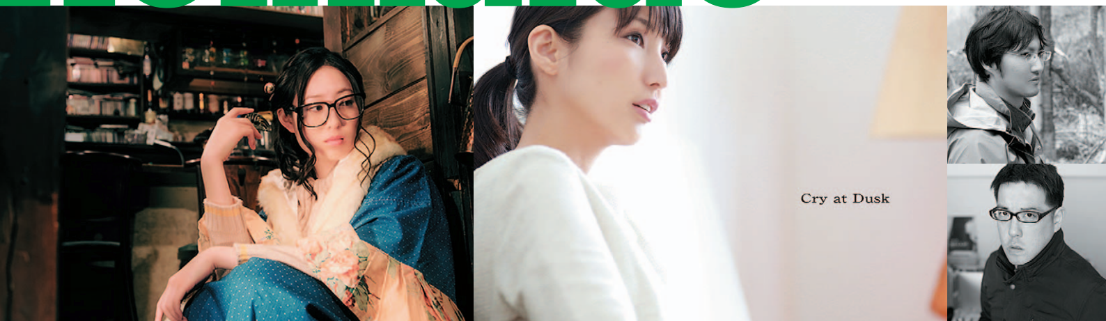
Cry at Dusk

第9回札幌国際短編映画祭 北海道映像監督作品上映会 & セミナー ～映像コンテンツにみるビジネスのヒント～